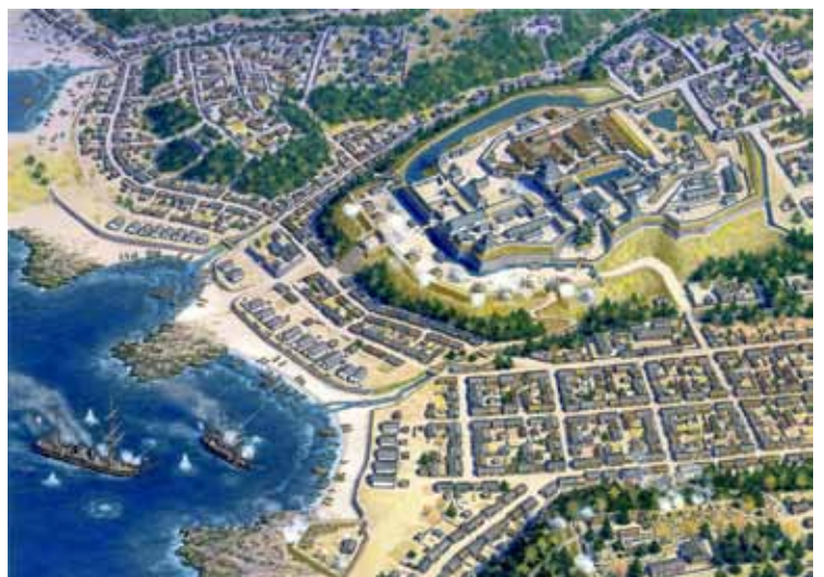
「松前城の戦い」 1999年 アクリル/紙

Kushiro City Museum of Art 〒085-0836 釧路市幣舞町4番28号 TEL 0154-41-8181・42-6116(直通) FAX 0154-41-8182