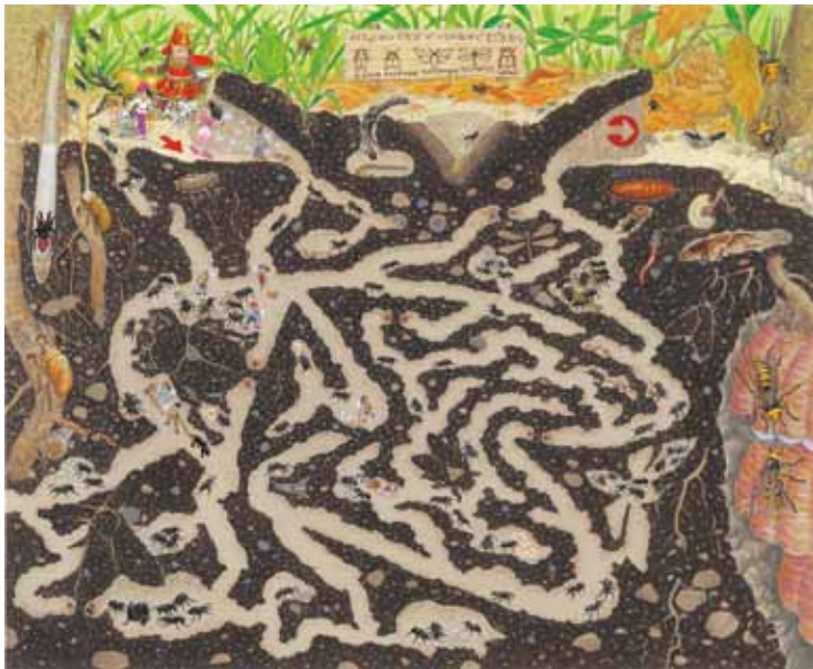
「アリの地下街」 2010年 アクリル/紙

迷路やかくし絵の絵本、歴史考証のイラストを手がける香川元太郎(1959～)。累計270部を発行する「迷路絵本」は、絵本作家が正確さにこだわって、一枚一枚丁寧に描き下ろした‘遊んで学べる’シリーズです。絵の中には、迷路やかくし絵、クイズがたっぷり。お子様と一緒に、大人も時間を忘れて遊ぶことができます。『昆虫』『宇宙』『伝説』など、16のジャンル約150点の迷路絵本原画とともに、城図解などもあわせた香川元太郎の仕事をご紹介します。会場には、立体迷路も出現。ご家族やご友人と一緒に、楽しみ、学んでいただければ幸いです。